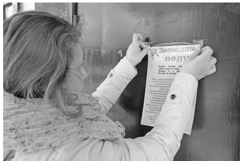
Листовки призывают беречь воду.