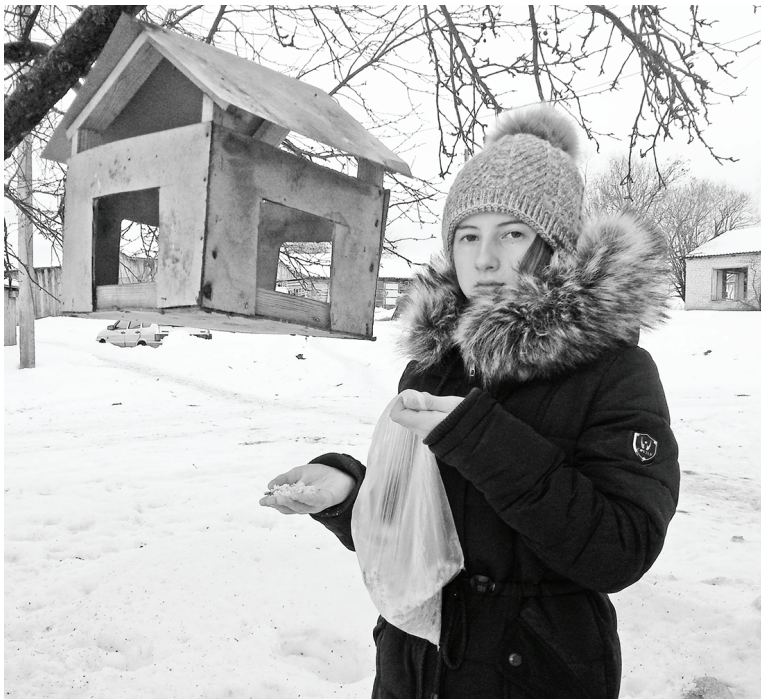
Зимой юные думиничане кормили птиц.

и побольше узнать о её жизни. Оказывается, туловище у неё очень тонкое, длинные крылья, ноги короткие, длинные пёристые уши, а на голове — яркий венчик.