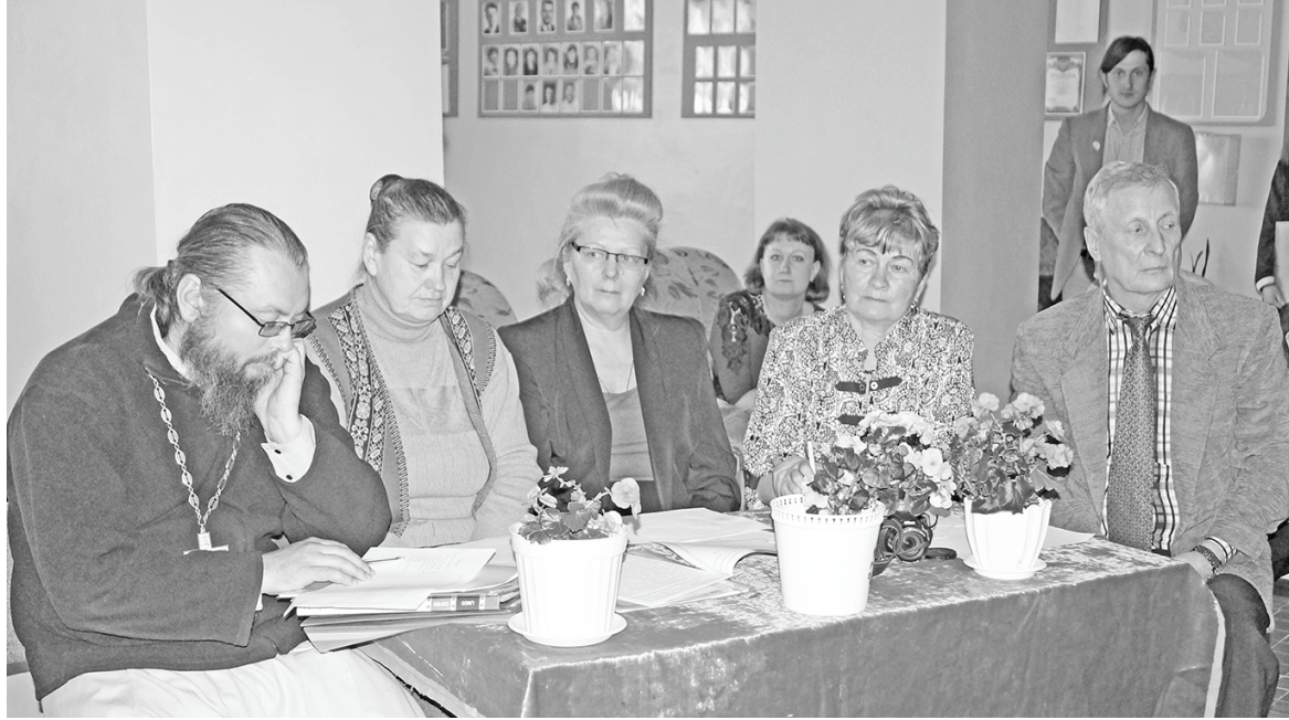
Компетентное жюри за работой.

Во вторник 4 апреля в Чернышенской школе после уроков никто не спешил домой. На этот день там была запланирована краеведческая конференция о прошлом и настоящем села и связи с ним старинного рода Скобелевых. К форуму давно готовились и учителя, и школьники. Его посвятили 75-летию освобождения от немецко-фашистских захватчиков.