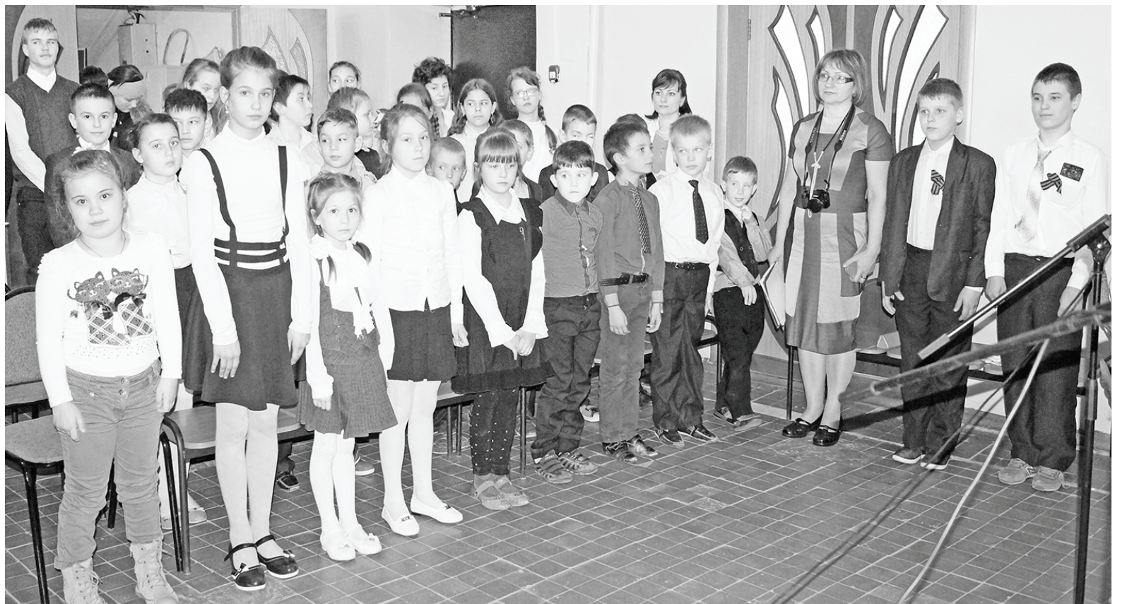
Звучит гимн Калужской области.