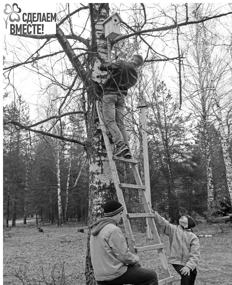
Строится «Птичий квартал».