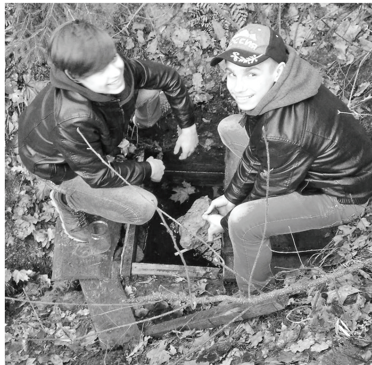
Живи, родник, живи!